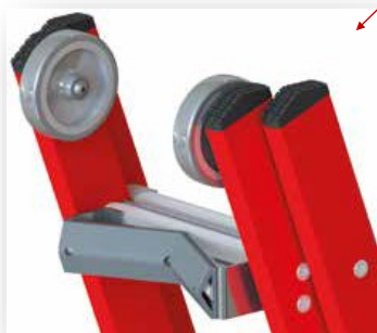
BERCEAU D'APPUI POTEAU & ROUES DE FACADE